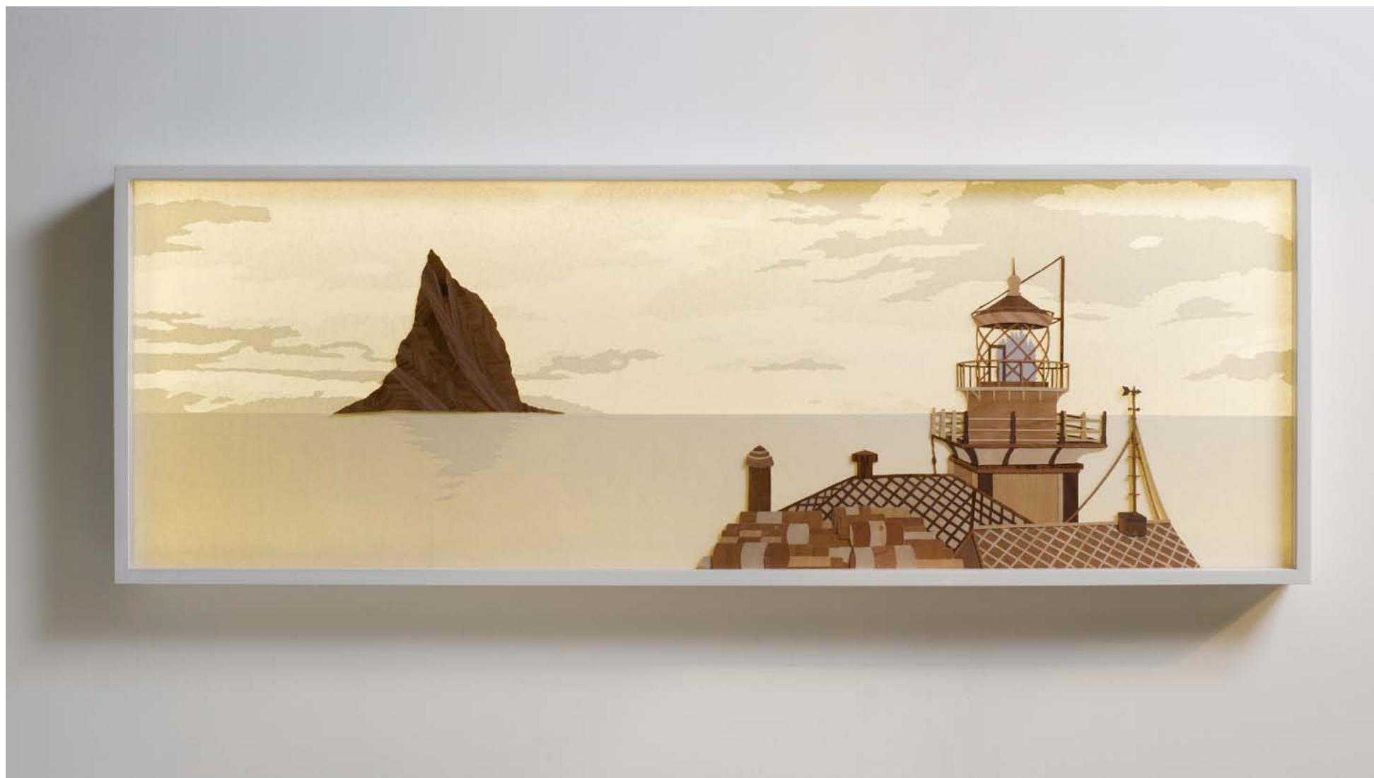
סיפורי מגדלורים 2 / 2011 / 20 שכבות פורניר נייר ואור / 40 x 120 סמ' Lighthouses stories 2 / 2011 / 20 Layers of Veneer, paper and light / 40 x 120 cm