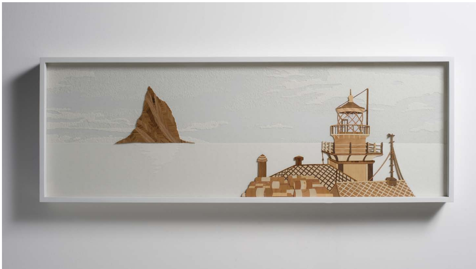
סיפורי מגדלורים 2 / 2011 / 20 שכבות פורניר נייר ואור / 40 x 120 סמ' Lighthouses stories 2 / 2011 / 20 Layers of Veneer, paper and light / 40 x 120 cm