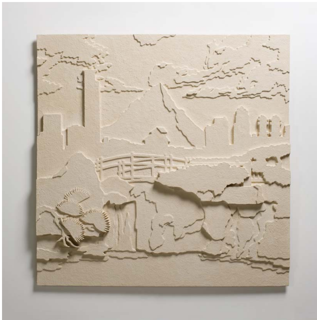
נוף עם מפל / 2011 / טכניקה מעורבת / 100 x 100 סמ' Landscape with Waterfall / 2011 / Mixed technique / 100 x 100 cm