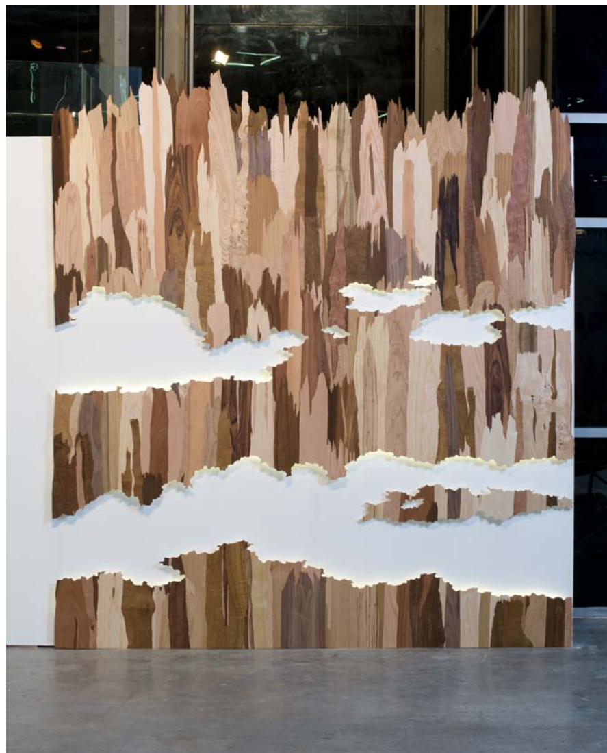
שמאי פורניר / 2011 / פורניר, עץ ואור / 260 x 250 סמ' Veneer Sky / 2011 / Veneer, wood and light / 260 x 250 cm