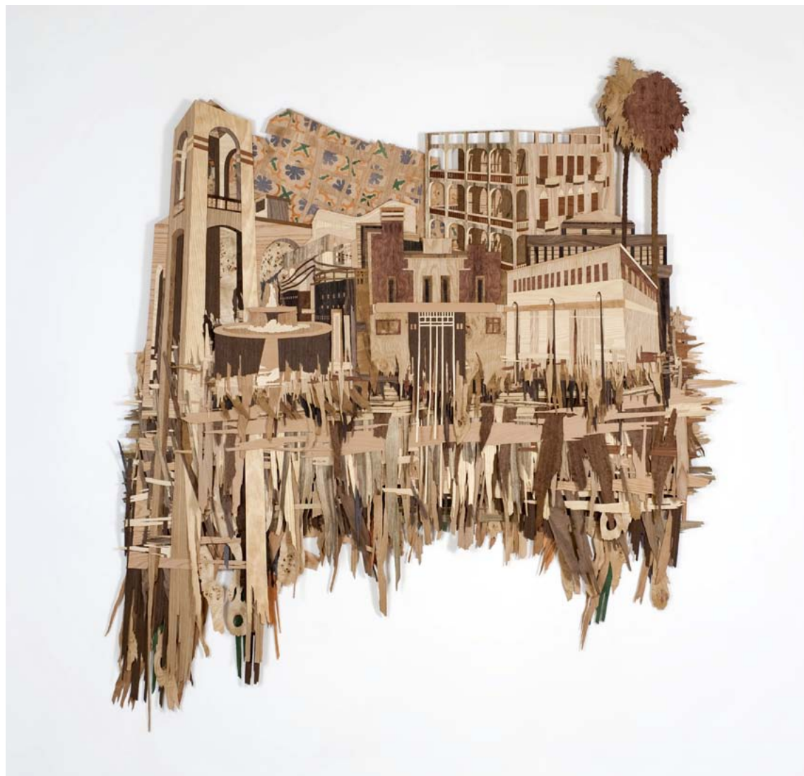
שד' ירושלים / 2010 / שכבות פורניר / 186 x 200 סמ' Jerusalem Boulevard / 2010 / Veneer Layers / 200 x 186 cm