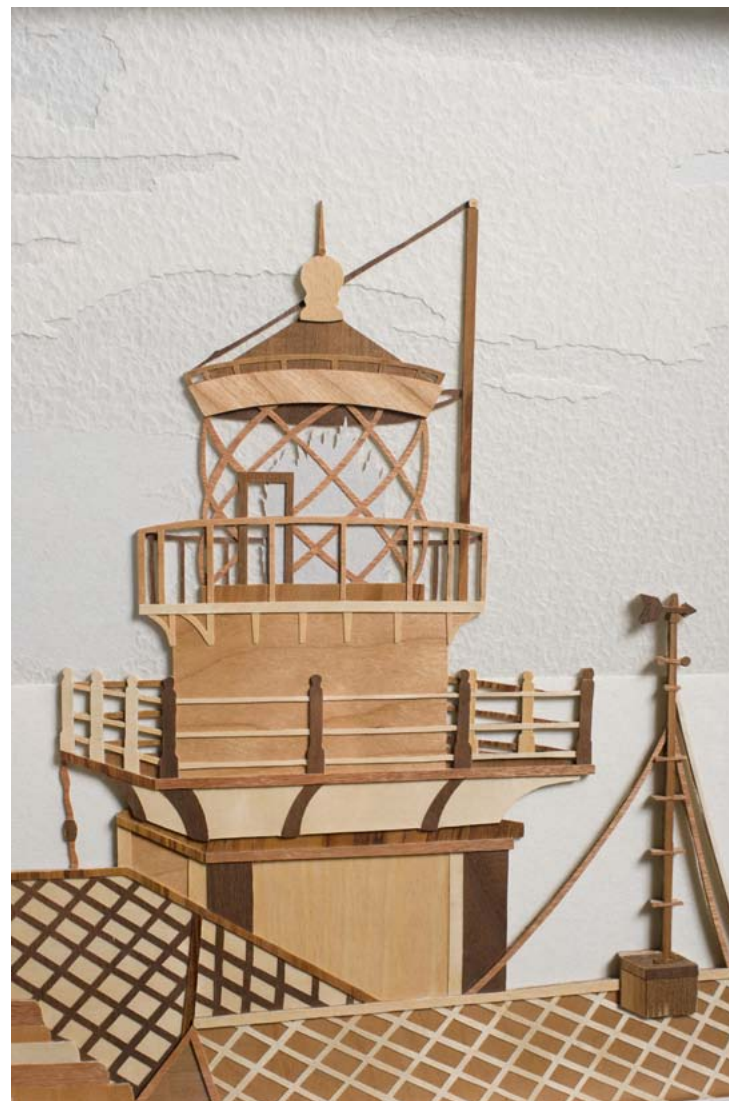
פרט מסיפורי מגדלורים 2 / 2011 / 20 שכבות פורניר נייר ואור / 40 x 120 סמ' Detail from Lighthouses stories 2 / 2011 / 20 Layers of Veneer, paper and light / 40 x 120 cm