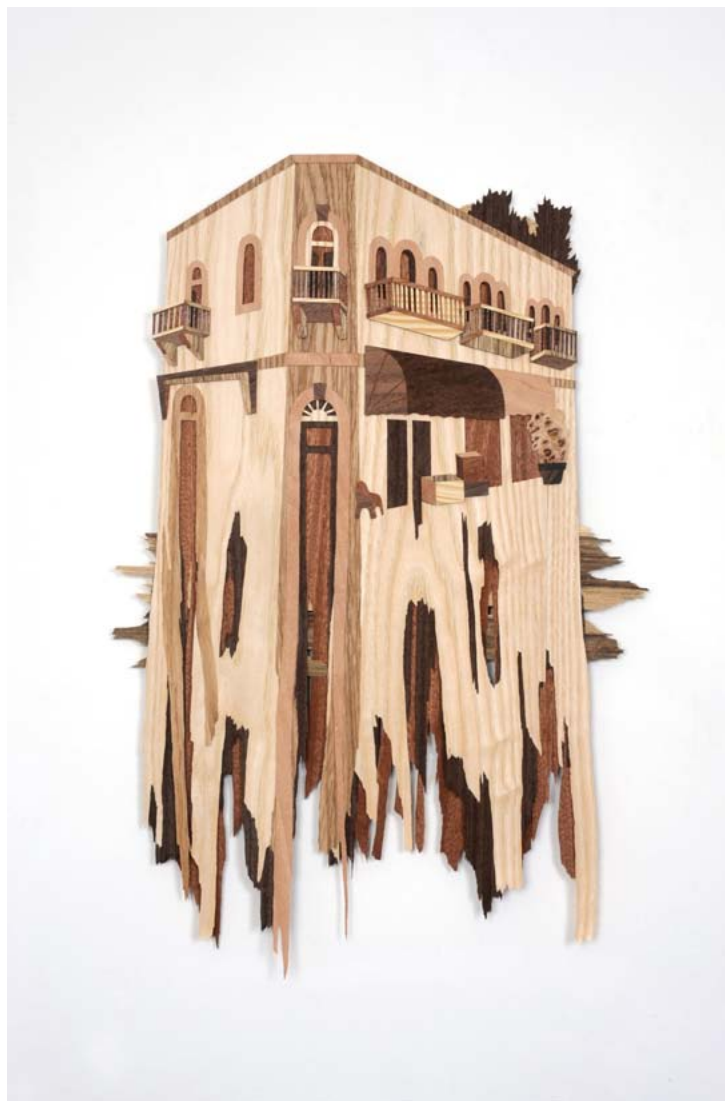
פרגמנט עין כרם 4 / 2010 / שכבות פורניר / 65 x 43 סמ' Ein Karem fragment 4 / 2010 / Veneer Layers / 65 x 43 cm