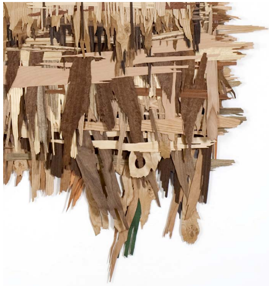
פרטים משד' ירושלים / 2010 / שכבות פורניר / 186 x 200 סמ' Details from Jerusalem Boulevard / 2010 / Veneer Layers / 200 x 186 cm