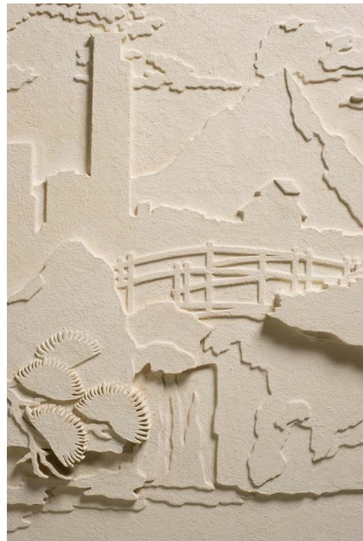
פרטים מנוף עם מפל / 2011 / טכניקה מעורבת / 100 x 100 סמ' Details from Landscape with Waterfall / 2011 / Mixed technique / 100 x 100 cm